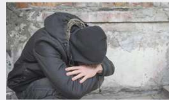
Türkiye'de uyuşturucu suçları artıyor