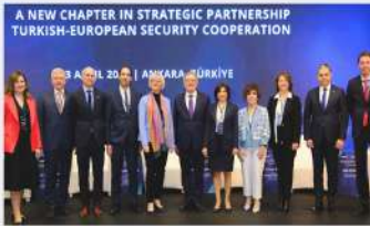
Türkiye-AB güvenlik denkleminde stratejik uyum ve güven inşası öne çıkıyor