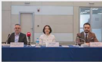
Dijitalleşen suç yapıları gençlerle kurduğu temasla büyüyor