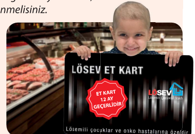
Lösemili çocuklar ve onko hastalarına özeldir.

- Yaşasın LÖSEV! Hemen arıyoruz. 0312 447 06 60